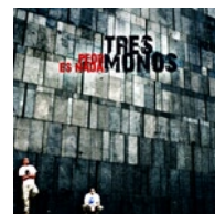
Peor Es Nada CD-Album VÖ.: 09.01.06