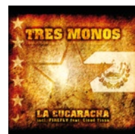
La Cucaracha CD-Single VÖ.: 20.06.2005